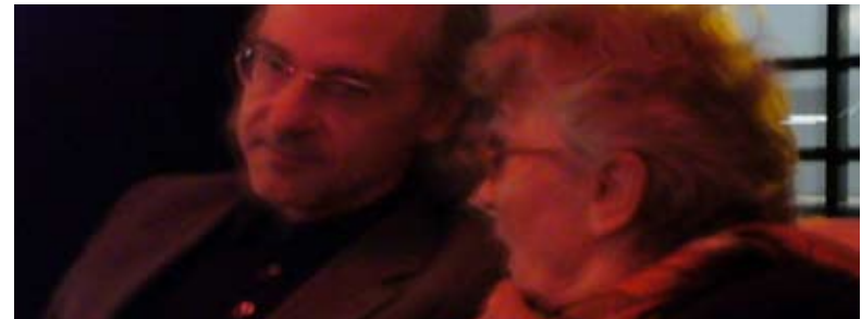
Eliane Radigue &amp; Charles Curtis