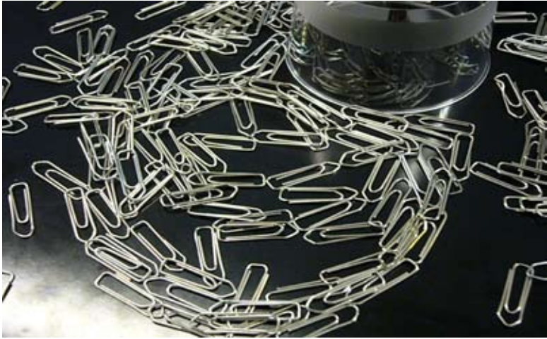
Doris Kuwert 'domestic objects'